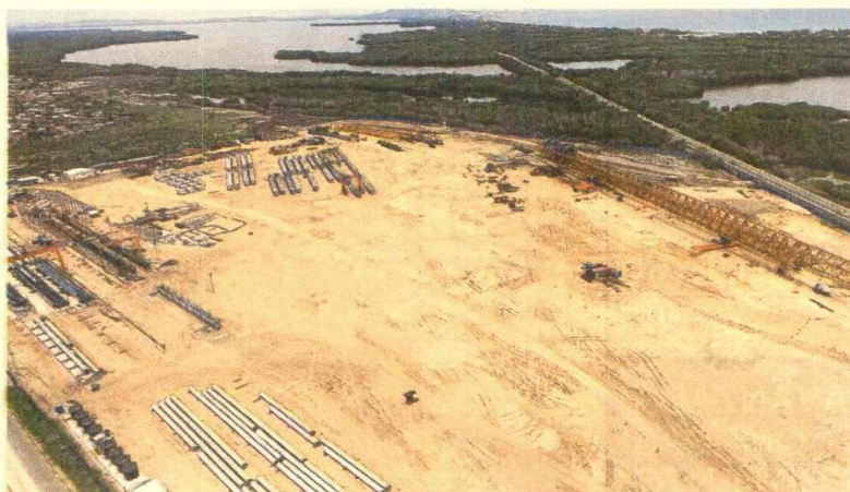
En la Concesión Cartagena-Barranquilla se construirá el viaducto más largo que tendrá el país. Su longitud es aproximadamente de 5 kilómetros.

La participación del mercado de capitales en la financiación del proyecto tuvo un componente en UVR por un monto de $327.000 millones y otro componente en dólares que ascendió a los US$150,8 millones. Así mismo, recibió un crédito de la Financiera de Desarrollo Nacional (FDN) por $ 217.500 millones. Con este desembolso, se completan cuatro proyectos de la primera ola de las vías de cuarta generación que podrán ejecutar las obras de construcción con dinero financiado con la autopista Conexión Pacífico 1, la autopista Conexión Pacífico 3, y la Perimetral del Oriente de Cundinamarca.